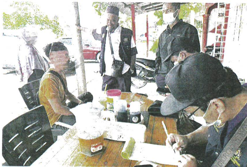
ANGGOTA penguat kuasa JKNT mengeluarkan kompaun terhadap individu yang merokok di tempat awam di Batu Buruk, Kuala Terengganu semalam.

AKHBAR : KOSMO MUKA SURAT : 16 RUANGAN : NEGARA