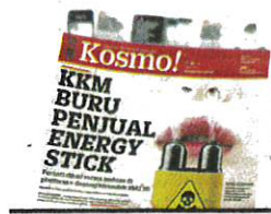
KERATAN Kosmo! 5 Februari 2024.

yang lain, masih terdapat beberapa peniaga yang menjual penyedut hidung tersebut, namun tidak seaktif sebelum ini dengan kurang dari lima produk terjual sehari.