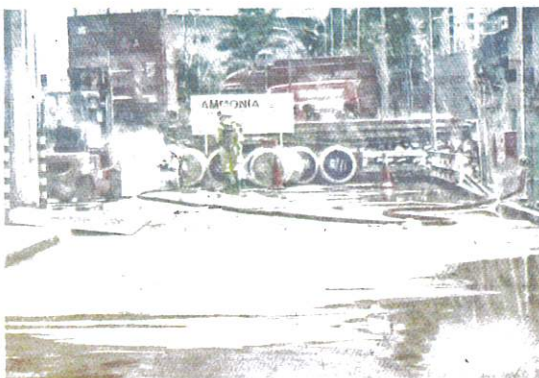
ANGGOTA bomba memeriksa kebocoran gas ammonia di salah sebuah kilang di Shah Alam semalam.